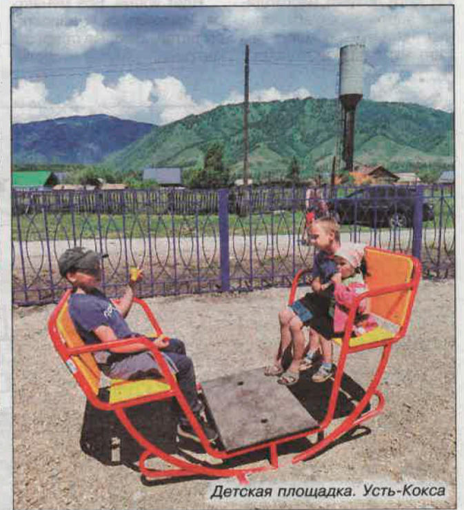
Детская площадка. Усть-Кокса

ные взрослые обратились в сельскую администрацию, вместе составили проект и отправили его на конкурс. Проект получил добро - субсидия из республиканского бюджета составила 500 тысяч рублей. Почти 20 тысяч добавил район, 63,5 тысячи собрали жители, еще 9,26 - спонсоры. Нефинансовый вклад граждан (покраска оборудования и т.д.) оценен в 62 тысячи рублей. Открытие площадки состоялось летом 2023-го. Эмоции жителей, особенно самых юных, запечатлены на фотографиях с мероприятия. На площадку приходят