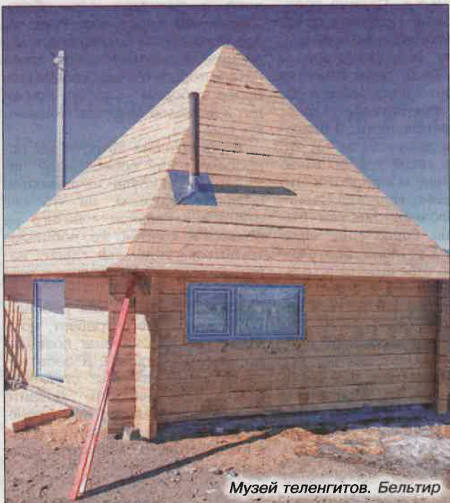
Музей теленгитов. Бельтир

Подготовила Галина МИРОНОВА по заказу Министерства финансов Республики Алтай